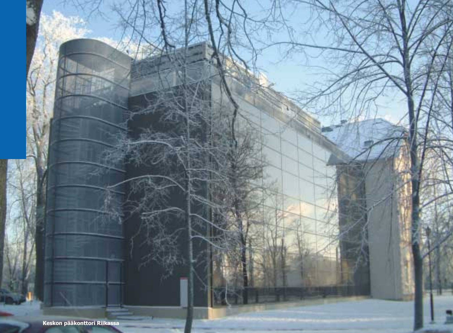
Keskon pääkonttori Riiikassa