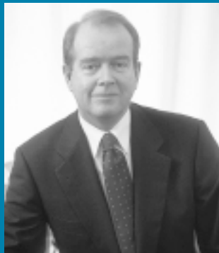
Oscar von Sydow