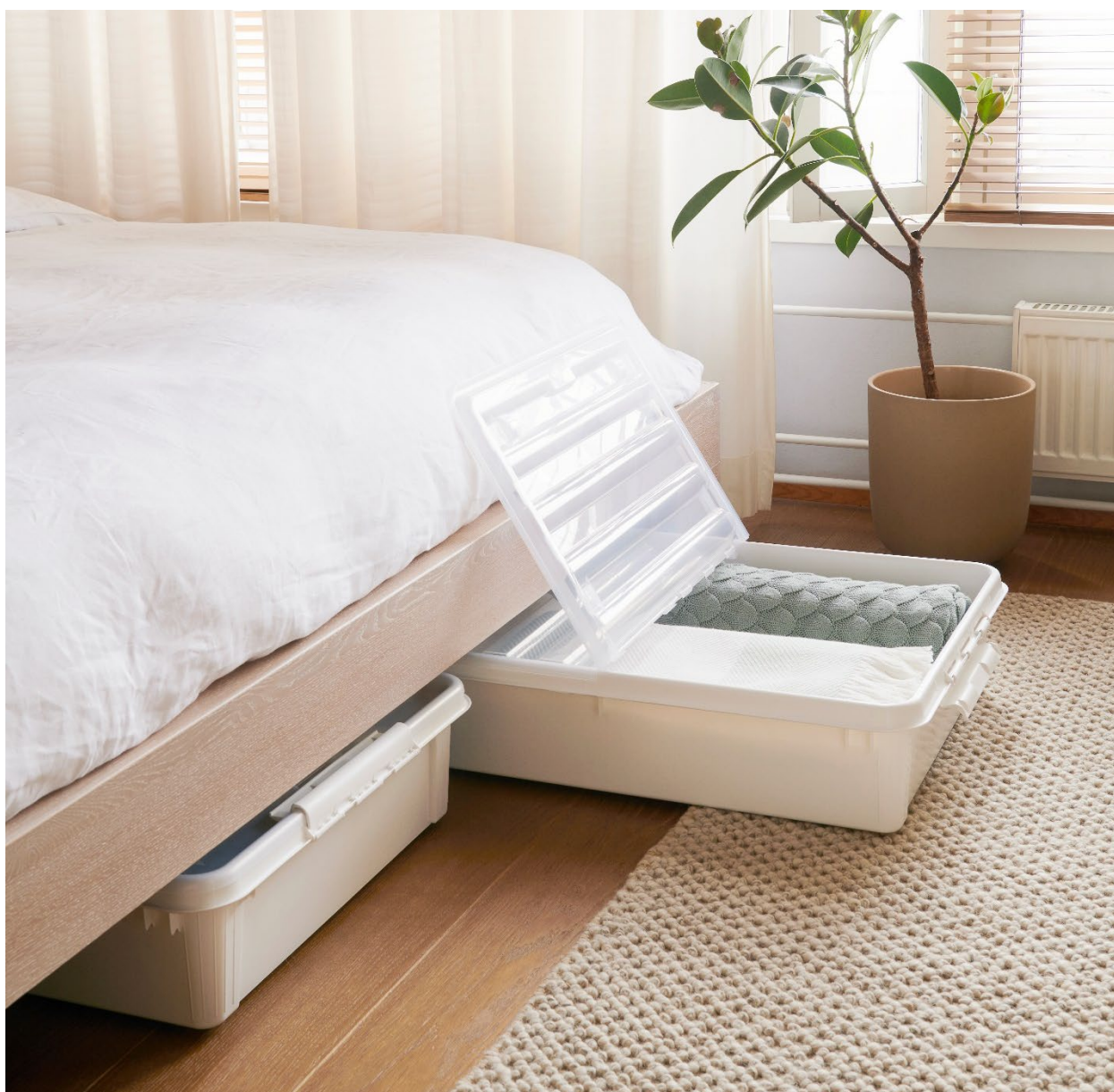
SmartStore bedroller 60 L

Vahva sitoutuminen strategiaan ja ennakoiva lähestymistapamme nopeasti muuttuviin markkinaolosuhteisiin tuovat mukanaan myönteistä kehitystä. Työntekijöidemme periksiantamattomuus ja sidosryhmiemme tuki ovat menestymisen avaintekijöitä. Teemme määrätietoisesti töitä pitkän aikavälin tavoitteidemme toteuttamiseksi.